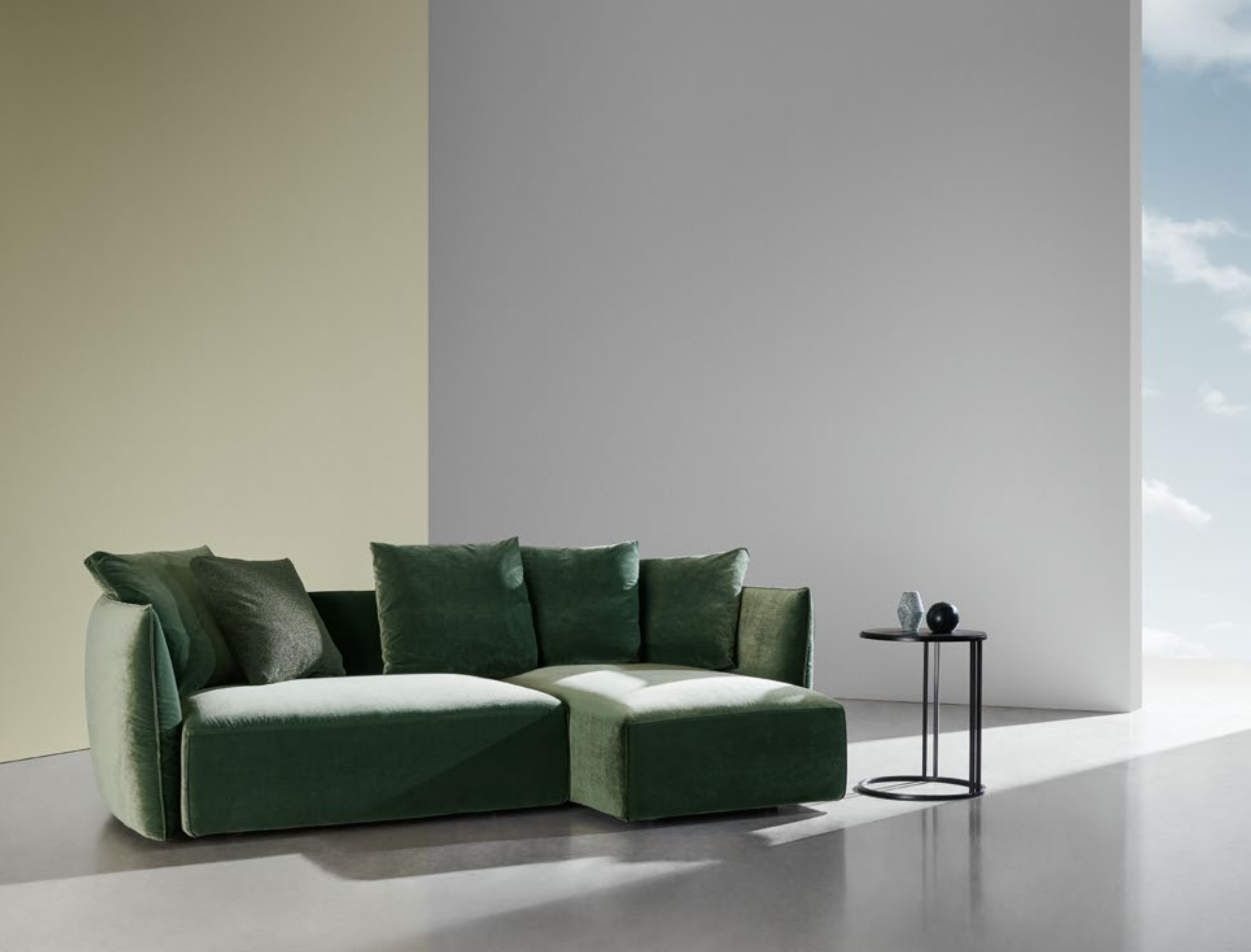
fabric Velvet 969 col. 070 cat. Must