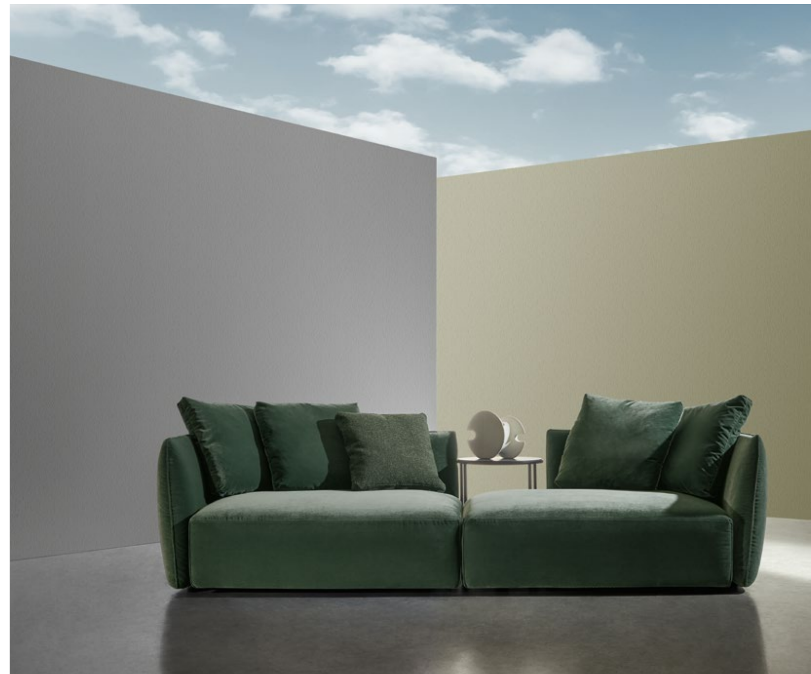
fabric Velvet 969 col. 070 cat. Must